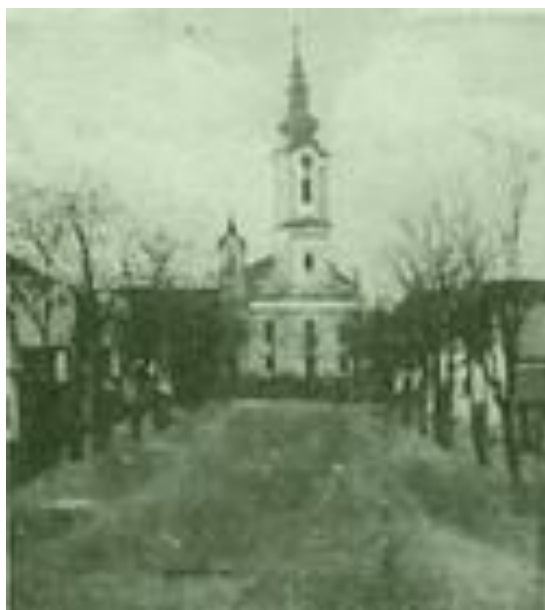
Nagyszékelyi képeslaprészlet felnagyítva 1935-ből